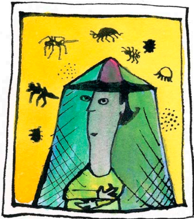
Matka-apteekki, Trendi -lehti, 1998