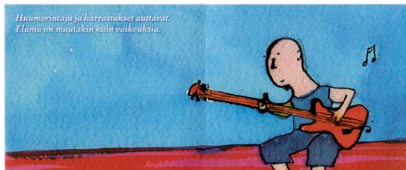
Apua luottamushenkilöiden jaksamiseen -esite, Metalliliitto 2007