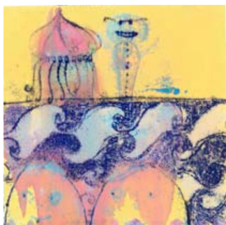
Kuuntele! Uskalluksen hengetär pitää rohkaisevaa puhetta empiville. 2012, monotypia