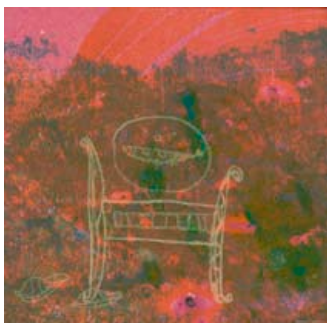
Aamun virkku 2011, monotypia ja kohopaino