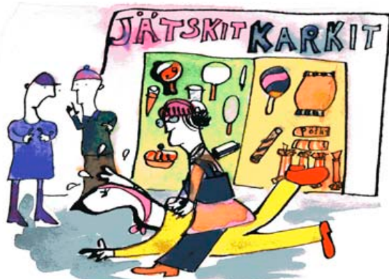
Mä haluan!, HS Nyt-liite 2006