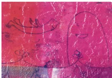
Suuri hyppy johtaa suureen yllätykseen! 2012, monotypia