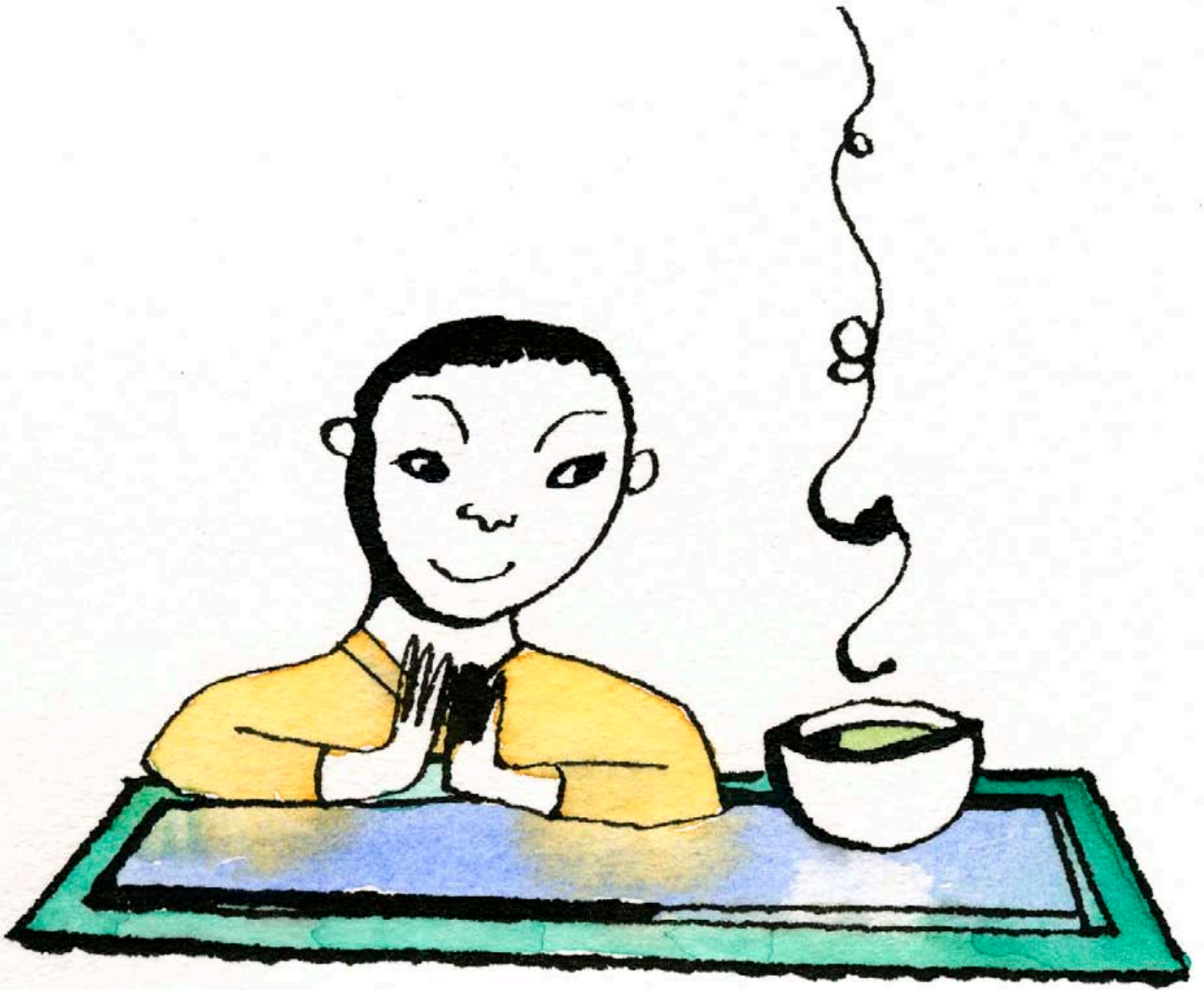
Vihreä tee, Hyvä Terveys -lehti 2006