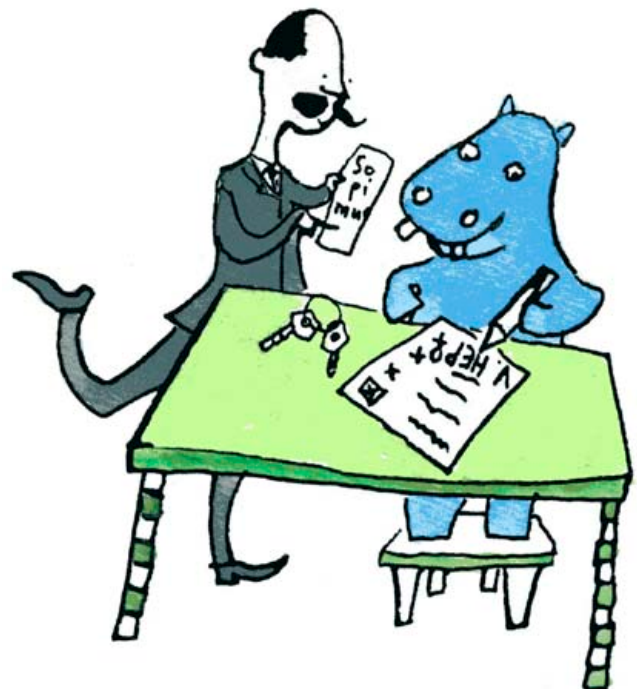
Virtahepo vuokra-asunnossa, Kuluttaja -lehti 2003