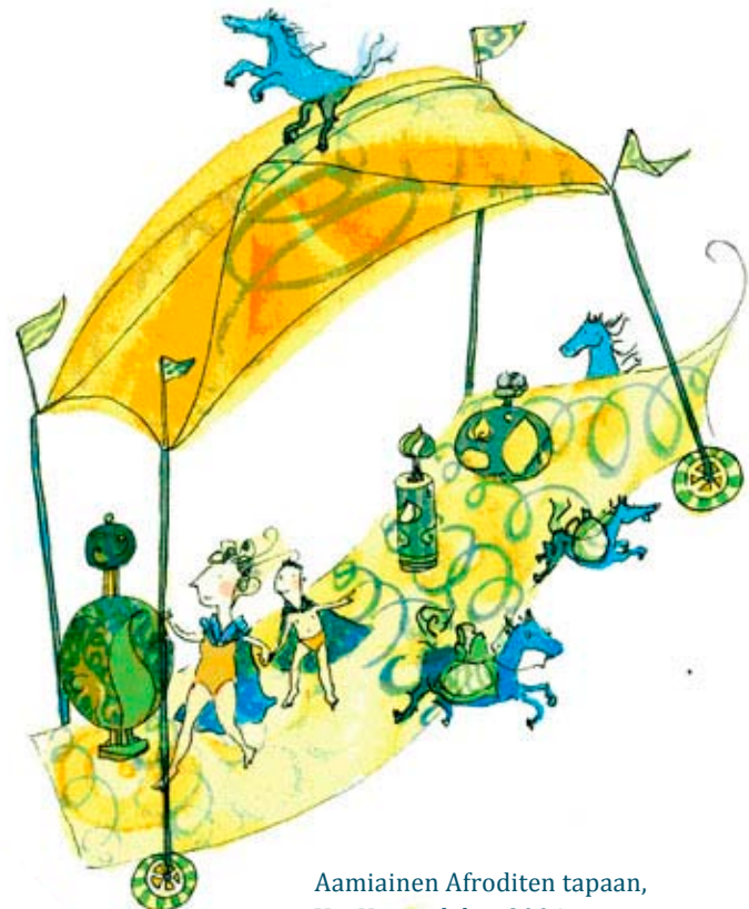
Aamiainen Afroditen tapaan, Voi Hyvin -lehti, 2004