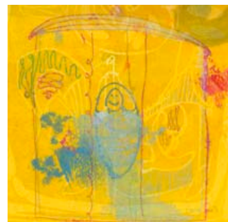
Iloinen muumio 2010, monotypia ja kohopaino